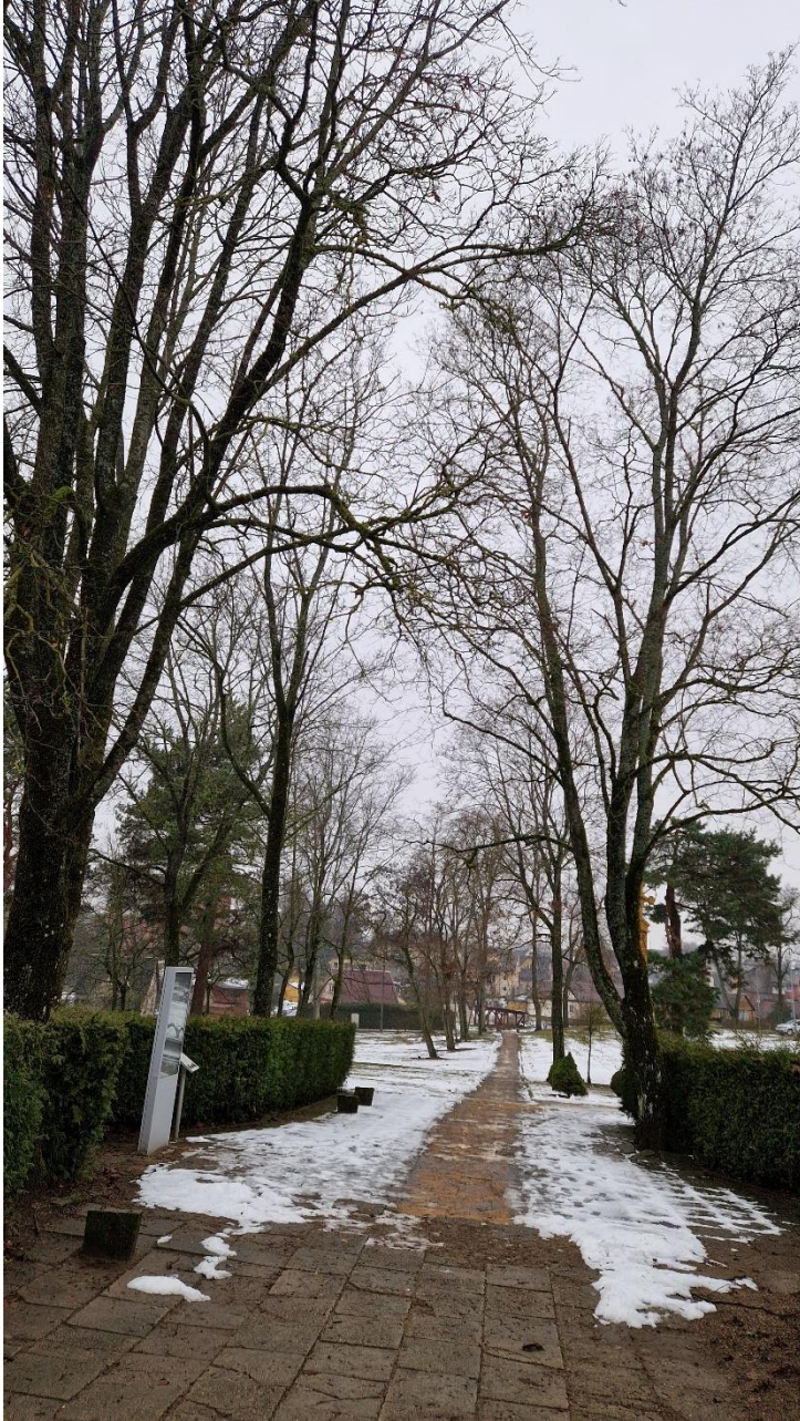
Palei takelį augančių medžių lajos per tankios