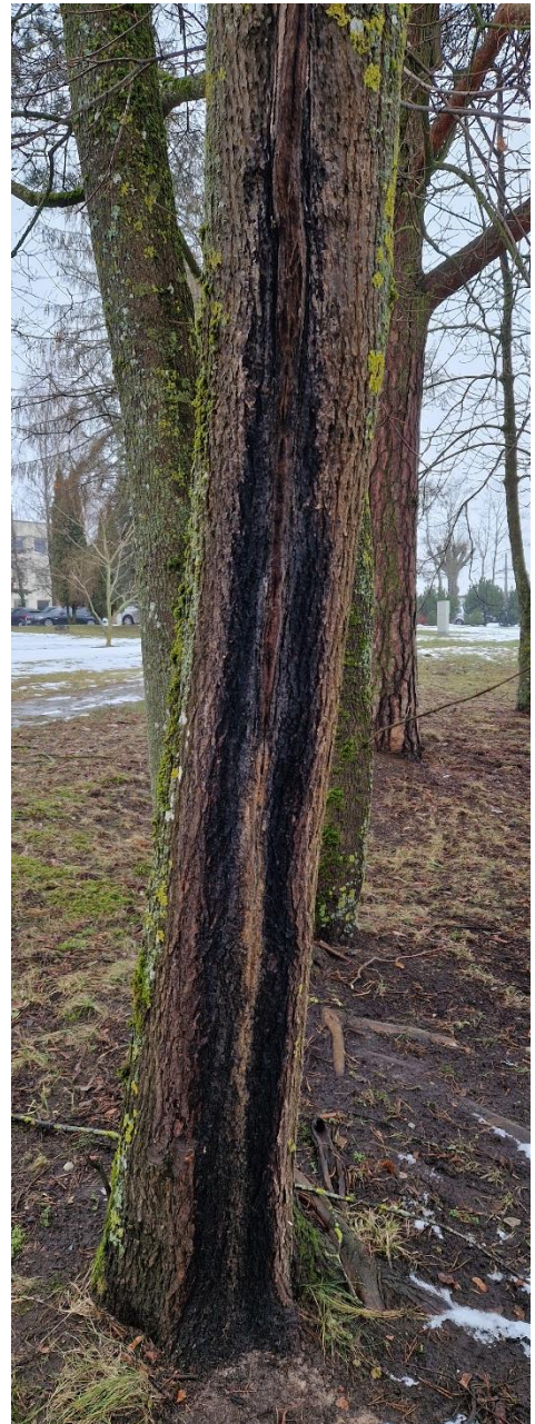
Šlapiuojanti žaizda, neperspektyvus