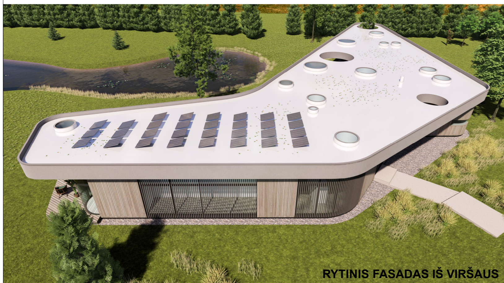
RYTINIS FASADAS IŠ VIRŠAUS