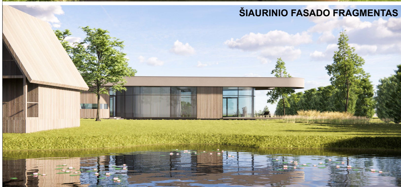
ŠIAURINIO FASADO FRAGMENTAS